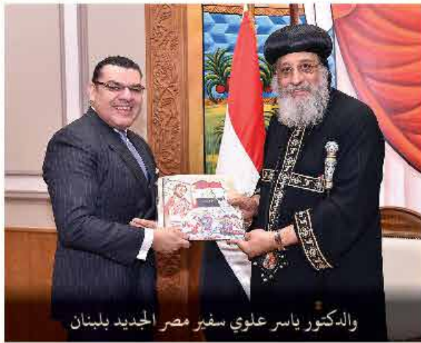
والدكتور ياسر علوي سفير مصر الجديد بلبنان