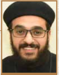
الفتوحى يوحنا نصيف كنييسة البشارة العذراء / شيكاغو