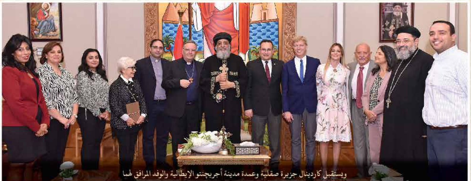
ويستقبل كاردينال جزيرة صقلية وعمدة مدينة أريجنتو الإيطالية والوفد المرافق لهما