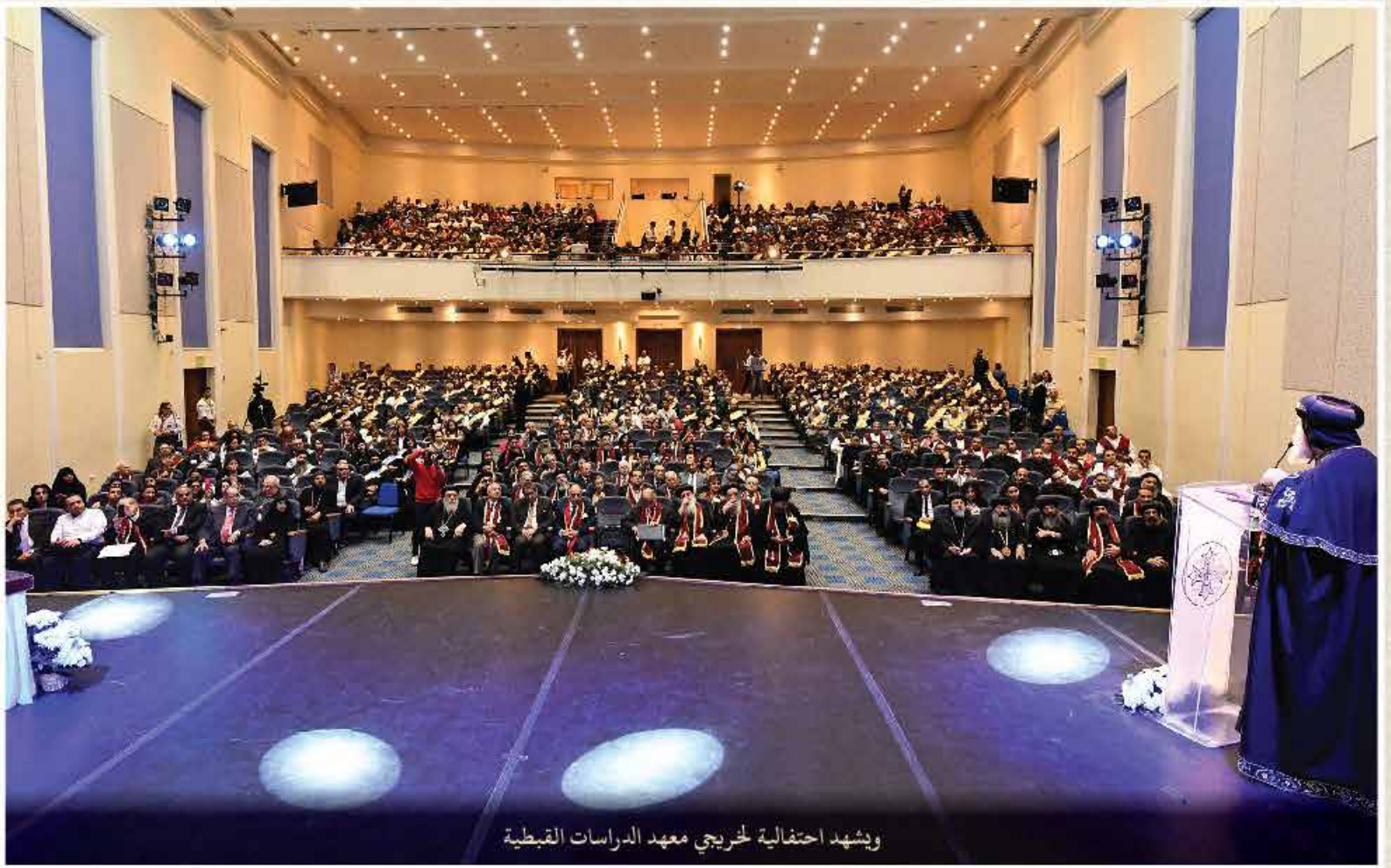
ويشهد احتفالية لخريجي معهد الدراسات القبطية