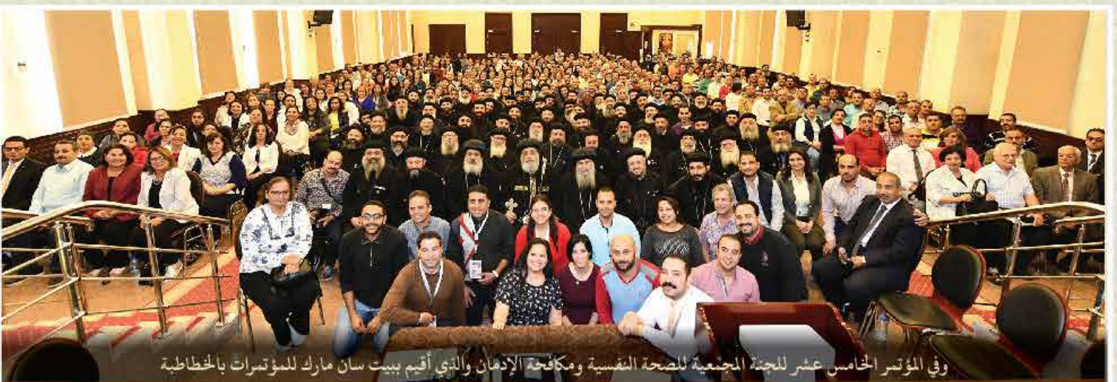
وفي المؤتمر الخامس عشر للجنة الجمعية للصحة النفسية ومكافحة الإدمان والذي أقيم بيت سان مارك للمؤتمرات بالخطاطبة