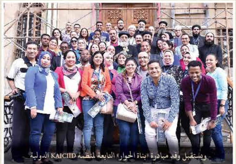
ويستقبل وفد مبادرة «بناة الحوار» التابعة لمنظمة KAICIID الدولية