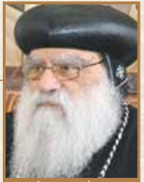
زيارة البابا بنديكتوس طركا لجميرة ودرع وشمال افريقا