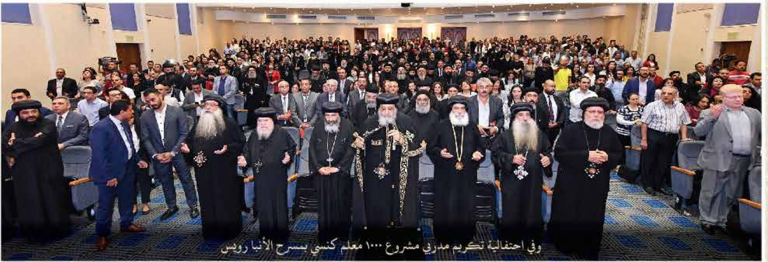
وفي احتفالية تكريم مدربي مشروع ١٠٠٠ معلم كنسي بسرح الأنبا رويس