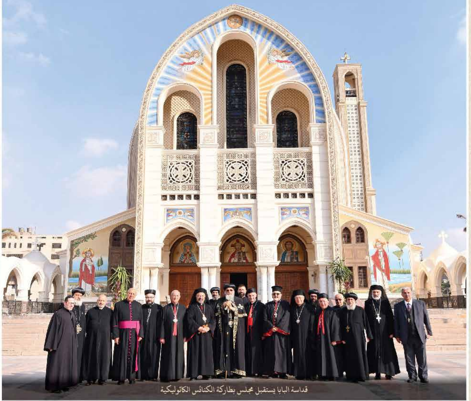
قداسة البابا يستقبل مجلس بطاركة الكنائس الكاثوليكية