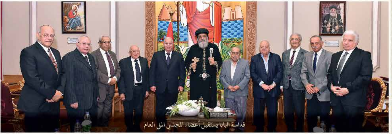
قداسة البابا يستقبل أعضاء المجلس الملي العام