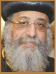
بشارة البابا القديس بطرس