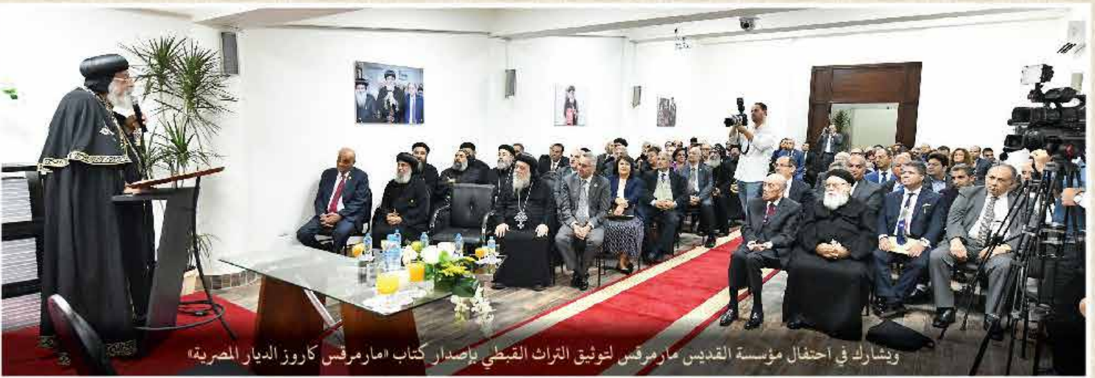
ويشارك في احتفال مؤسسة القديس مارمرقس لتوثيق التراث القبطي بإصدار كتاب «مارمرقس كاروز الديار المصرية»