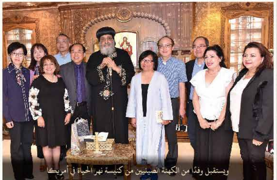
ويستقبل وفدًا من الكهنة الصينيين من كنيسة نهر الحياة في أمريكا