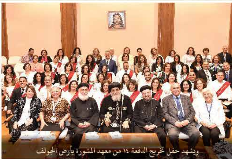
وشهد حفل تخريج الدفعة ١٤ من معهد المشورة بأرض الجولف