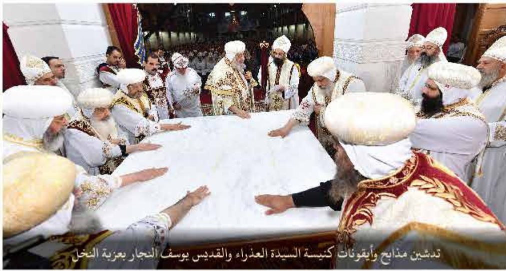
تدشين مذابح وأيقونات كنيسة السيدة العذراء والقديس يوسف النجار بعزبة النخل