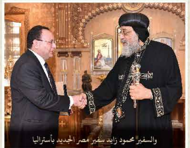
والسفير محمود زايد سفير مصر الجديد بأستراليا