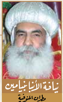
زيارة البابا بنيامين طركا المنوفية

وضع الله آدم وحواء في فردوس معه لتحقيق هذا الهدف الهام، وهو الشركة الحياتية مع الله للتعبير عن الحب المتبادل بين الله والبشرية منذ بدايتها بشخص آدم وحواء، لتحريك مشاعر قوية متبادلة بينهما لأنه خلق الإنسان على صورته ومثاله في القداسة والبر وحب الخير وتركيزه الروح فوق الجسد، لذلك عاش الإنسان في وجود دائم في حضرة الله، ليعمل في حياته معطيًا له نعمة الحياة النقية، ليرى كل شيء بعين الله، فلا يقوى الشيطان أن يحرقه عن هذا التوجه الهام بين