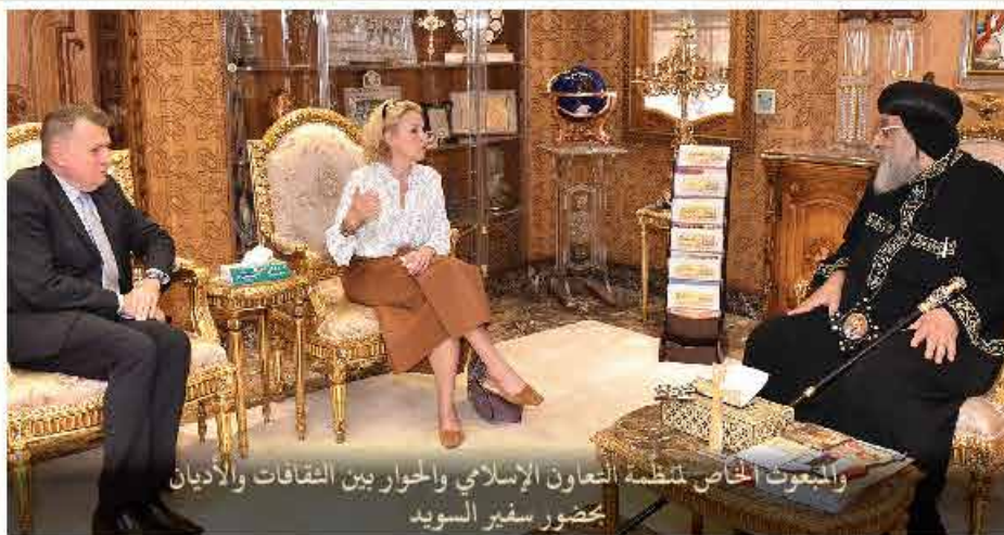
والجمعيات الخاصة لمنظمة التعاون الإسلامي والحوار بين الثقافات والأديان بحضور سفير السويد