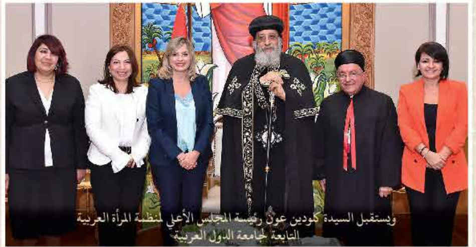
ويستقبل السيدة كودين عون رئيسة المجلس الأعلى لمنظمة المرأة العربية التابعة لجامعة الدول العربية