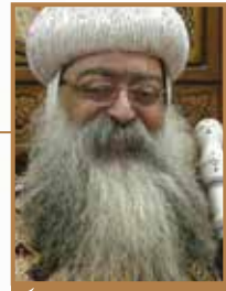
نيافة الأنبا تكللا أسقف دشنا

أو جلب خير أو قضاء مصلحة... (٣) الرغبة في المزاح: مثل (كذبة إبريل)، أو الرغبة في التهكم على الآخرين، خصوصاً من كانوا أضعف أو أقل ثقافة ومعرفة ومركزاً. (٤) حالة نفسية: فقد يكذب الإنسان بسبب حالة نفسية يعاني منها نتيجة تربيته المبكرة الخاطئة (كأن يكون قد تربى على الخوف مما يجعله هياجاً متردداً)، وقد يحدث أن يكبر الإنسان وتكون هذه الحالة قد تحولت فيه إلى عقدة نفسية تلازمه. (٥) عوامل نفسية أخرى: كالشعور بالنقص أو الخجل.. كالشباب الذي يجلس بين مجموعة من الشباب المستهتر الذين يفاخرون بمغامراتهم الشريرة، فينتحل هو الآخر قصصاً ومغامرات لكي ما يجاريهم. وكالشباب الذي ينشأ في عائلة فقيرة ويندمج في أوساط أرقى من مستواه الاجتماعي، فيكذب خجلاً وهو يتحدث عن نسبه وعائلته. (ب) خطورة خطية الكذب: (١) قد يكون سبباً في إخفاء خطأ معين مما يشجع على التمادي فيه. (٢) له علاقة كبيرة بخطايا أخرى مثل السرقة والغش، فهذه الثلاثة تتفق في صفة عدم الأمانة. (٣) خطية ضد الله باعتباره الحق (يو ١٤: ٦) وضد وصاياه «لا تسرقوا ولا تكذبوا...» (لا ١٩: ١١). (٤) إن الكذاب ينتسب للشيطان بل يُعتبر ابناً له، إذ قال الرب عن الشيطان «لأنه كذاب وأبو الكذاب» (يو ٨: ٤٤). (ج) عقوبة الكذب: (١) عقاب زمني: (أ) فقدان ثقة الناس واحترامهم نتيجة افتضاح كذبه: إذ قال الله «ليس مكتوماً لن يُستعلن ولا خفي لن يُعرف» (مت ١٠: ٢٦)، وكما يقول سفر الأمثال