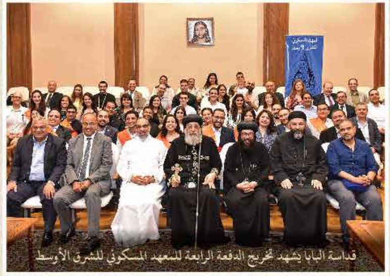
قداثة البابا تشهد تخريج الدفعة الرابعة للمعهد المسكوني للشرق الأوسط