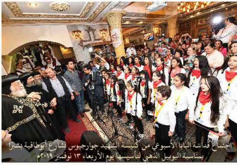
اجتماع قداثة البابا الاسبوعي من كنيسة الشهيد جارجيوس بشمارخ اوتوقاوية بشبرا بتناسه الوبيل الذهبي لتأسيسها يوم الأربعاء ١٣ نوفمبر ٢٠١٩م