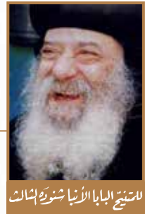
الشيخ البابا الأنبا شرويه بشات

مجلة الكرازة ٩ ديسمبر ٢٠٠٥ - العددان ٣٧-٣٨