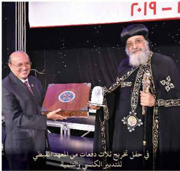
في حفل تخريج ثلاث دفعات من المعهد القبطي للتدبير الكنسي والتنمية