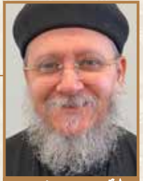
الفصحى يوحنا نصيف كنييسة البشارة العذراء / شيكاغو